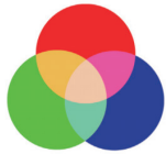
Mischfarben werden mit der Ansteuerung mehrerer Eingänge gleichzeitig erreicht. / Mixed colours will be achieved with the control of multiple inputs simultaneously.